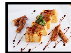
つまみ穴子卵焼き 700円