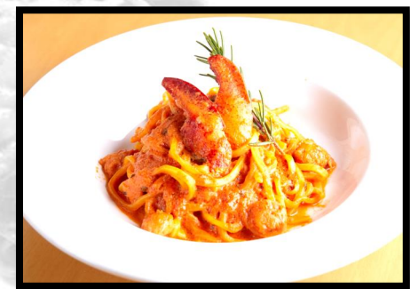
オマール海老とロブスターの トマトクリーム 1500円