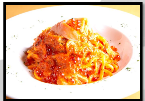
イクラとサーモンの トマトクリーム 1500円