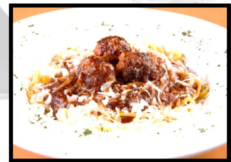
ミートボールミートソース 1500円