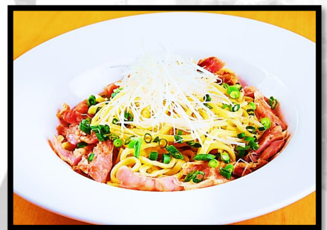
葱と豚肉の柚子胡椒和風 1300円